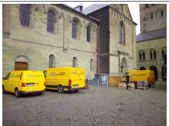
Wo ist eigentlich der Heizungskeller? fragen manche. Die Treppe an der Südseite derr Kirche führt zu ihm.

Da der Klingelbeutel z.Zt entfällt, teilen wir die Ausgangskollekte auf.