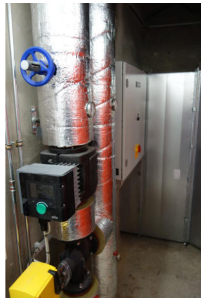
In einem weiteren Raum dahinter befindet sich die Anlage der Fa. MAHR. Von hier geht die Warmluft in die Kirche. Im mittleren Bild ein Gebläse. Die Aufteilung der Räume wurde neu vorgenommen. Alte Wände wurden herausgenommen, neue aufgemauert.