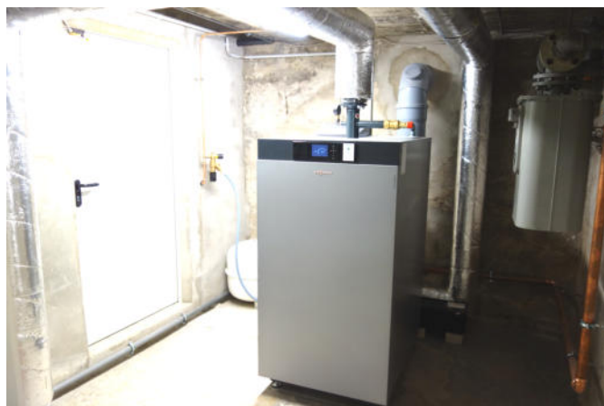
Im ersten Raum steht der Heizkessel. Hinter dem Kessel führt ein Rohr in den Kamin. Der Einbau der Abgasanlage war schwierig.