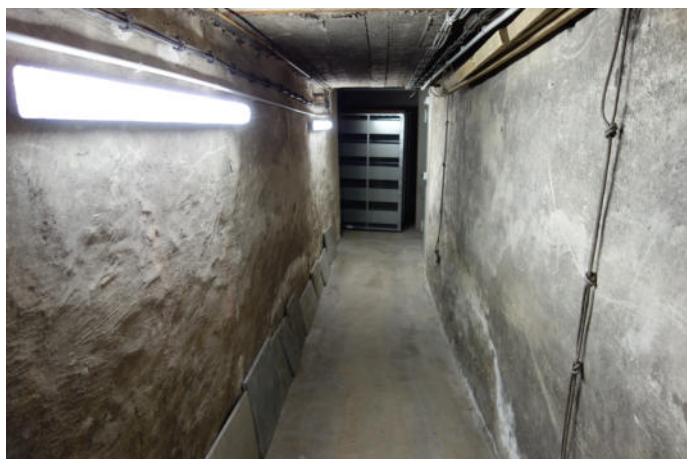
Der Gang im Heizungskeller ist gleichzeitig Luftkanal. Die Luft wird aus der Kirche angesaugt.