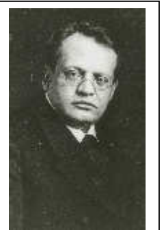
Max Reger (1873-1916)